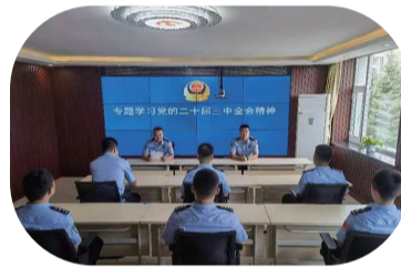
近日,延边边境管理支队二道边境检查站组织民警学习党的二十大精神。