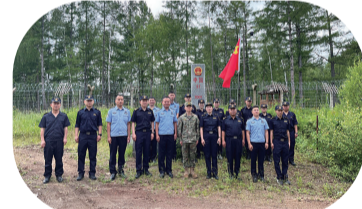
近日,延边边境管理支队双目峰边境检查站联合长白山海关开展“庆八一,进警营”系列活动。