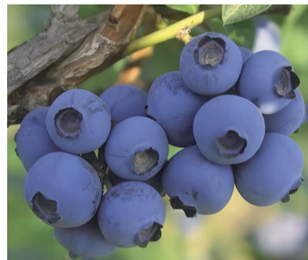
吉林裕泰特产开发有限公司通过持续完善蓝莓产业的配套设施和服务体系,为产业的可持续发展提供了坚实保障。公司将继续发挥技术优势和创新能力,为蓝莓产业发展贡献力量。

蓝莓产业已经成为靖宇县农民致富的“金色产业”,受到市场青睐的“朝阳产业”。公司优惠的收购价格为当地农民带来了稳定收入,不仅提高了农民的生活水平,也促进了蓝莓产业健康、快速发展。