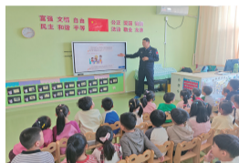
防溺水、防拐骗、防欺凌、防毒品等安全知识,为师生提供全方位的自我保护指导,使师生的法治意识和自我防范能力得到提升,为校园良好治安环境打下坚实基础。