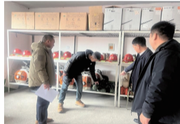
否规范。检查组对清水林场安全、防火工作给予肯定,并强调一定要牢固树立“防胜于救”的理念,切实做好安全生产工作,严防各类事故发生。

检查组听取清水林场近期安全、防火工作情况汇报,随后对安全生产工作情况进行检查,重点查看防火器具库设备维修情况及职工食堂用火、用电、用气安全状况,查看电气线路是否存在老化、私拉乱接现象,燃气设备有无泄漏隐患,炉灶使用是