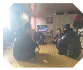
为让辖区老人感受到温暖与关怀,近日,龙井市开山屯边境派出所民警对辖区老人进行走访。