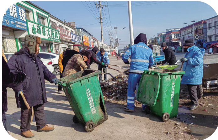
进入三月,公主岭市双城堡镇抓住有利时机,掀起大规模环境整治热潮。图为环卫工人清理镇区垃圾。