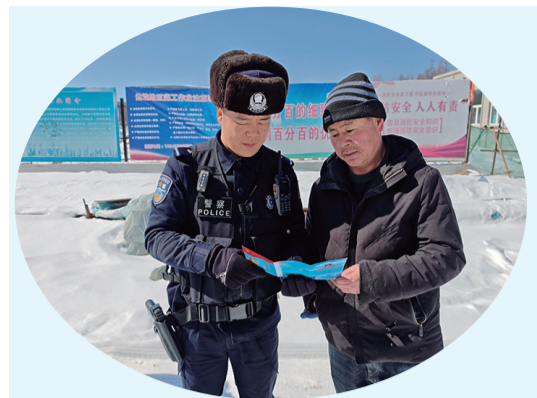
近日,延边边境管理支队双峰边境检查站开展边境政策法规宣传活动。

据了解,2024年望江村合作社果蔬种植产量提升至9万斤,增幅达30%,为村集体增收近15万元。志愿服务队深入田间地头和群众一起探索产业帮扶新模式,将贴心高效的绿色电能、优质服务送到大山深处的G331边境村,切实当好助力乡村振兴发展的“电力先行官”。