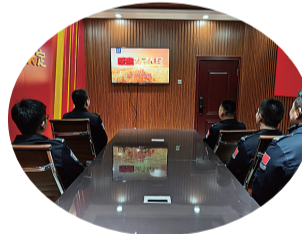
为进一步加强民警廉洁自律意识,延边边境管理支队双峰边境检查站组织民警观看廉政教育片。

截至目前,公司上线300余台新能源汽车,各平台待管车辆2400余台,多次荣获T3出行优秀管理运营商、滴滴最佳合作伙伴等称号。2023年8月,公司党支部和工会成立,标志着公司在规范化发展道路上又迈出坚实一步。